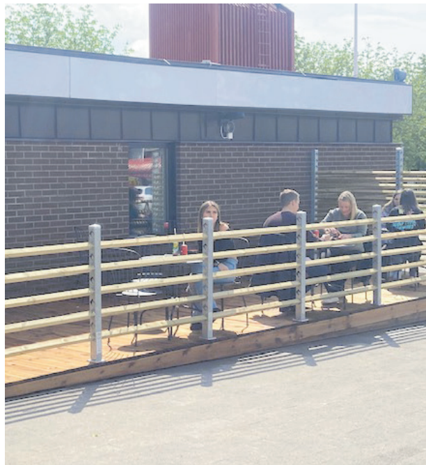
Kato Sushis uteservering lockade många i solskenet under premiärdagen.