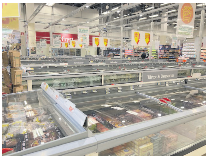
Kylar och frysar byts ut.