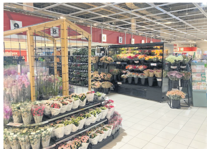
Blomdavelningen, är en av flera, som fått en ny plats.

kommer att bli enklare att hitta sina varor för kunderna.