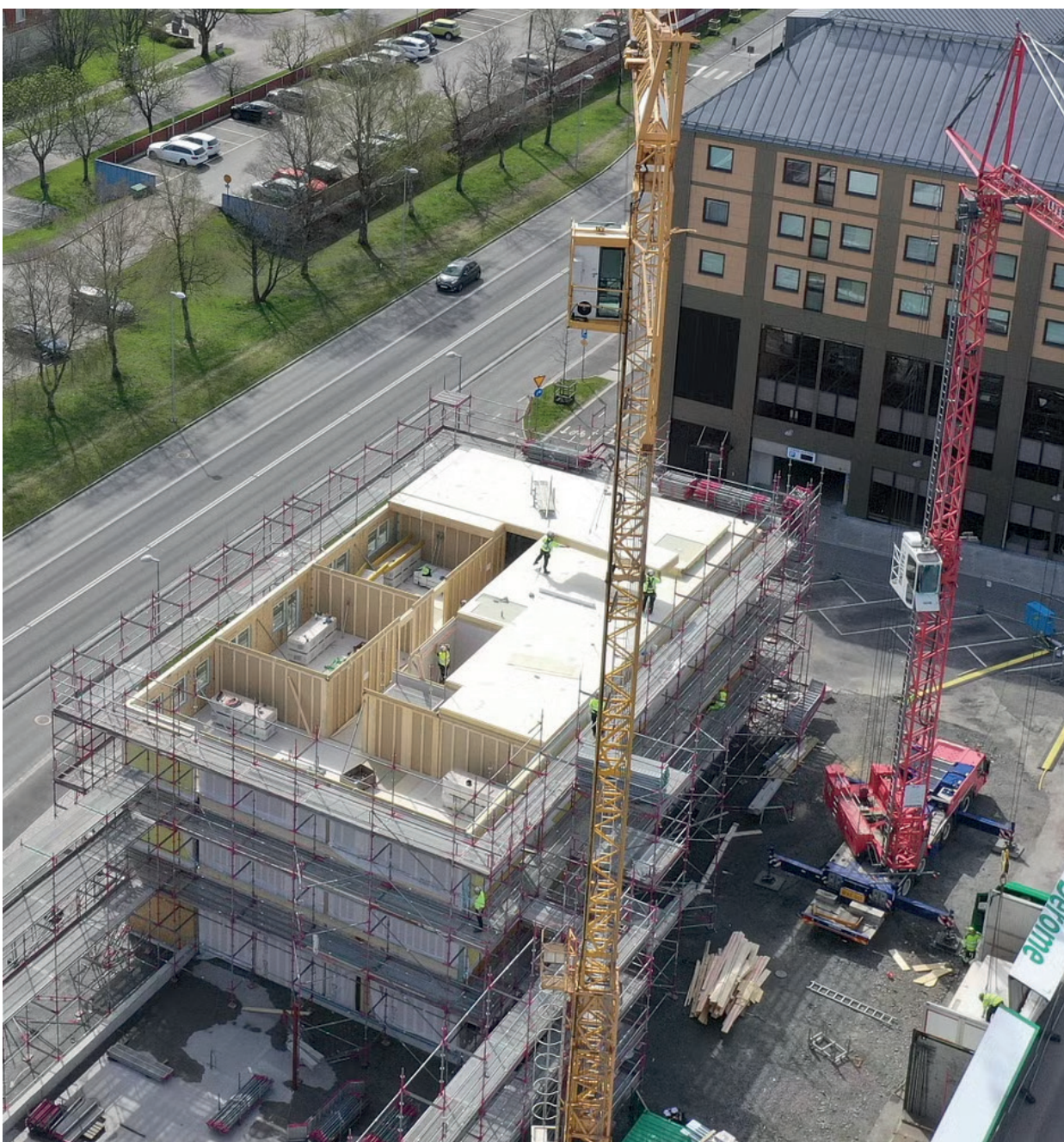
I Kvarteret Omställningen i Selma stad monteras nu trästommen.