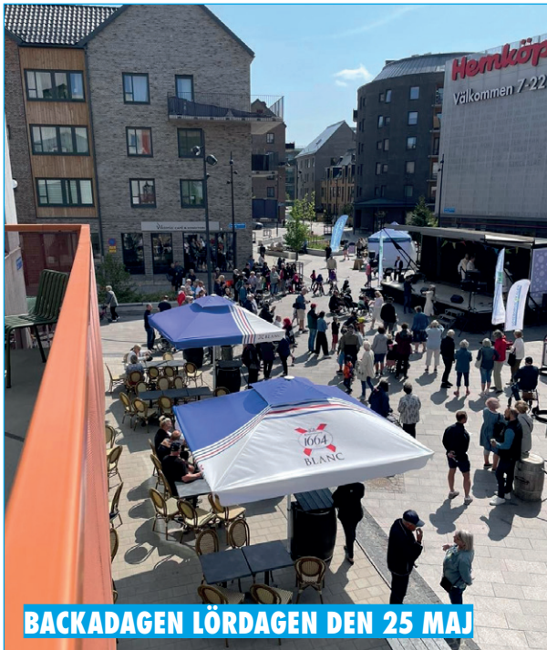
BACKADAGEN LÖRDAGEN DEN 25 MAJ