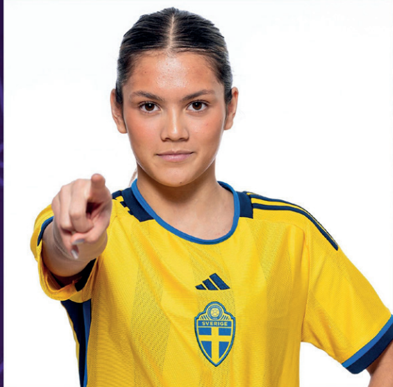
MOA FRÅN KÄRRA - LANDSLAGSPELARE I BÅDE FOTBOLL OCH HANDBOLL