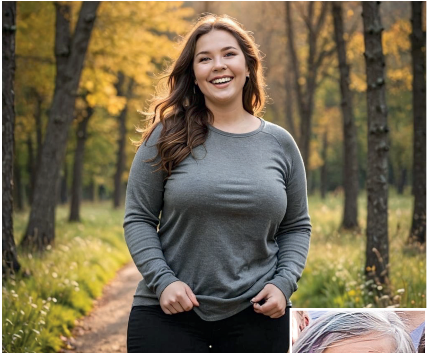
Rund och glad

har inte varit särskilt tjocka. Hur stor man är beror på hur mycket man äter i förhållande till hur mycket man behöver.