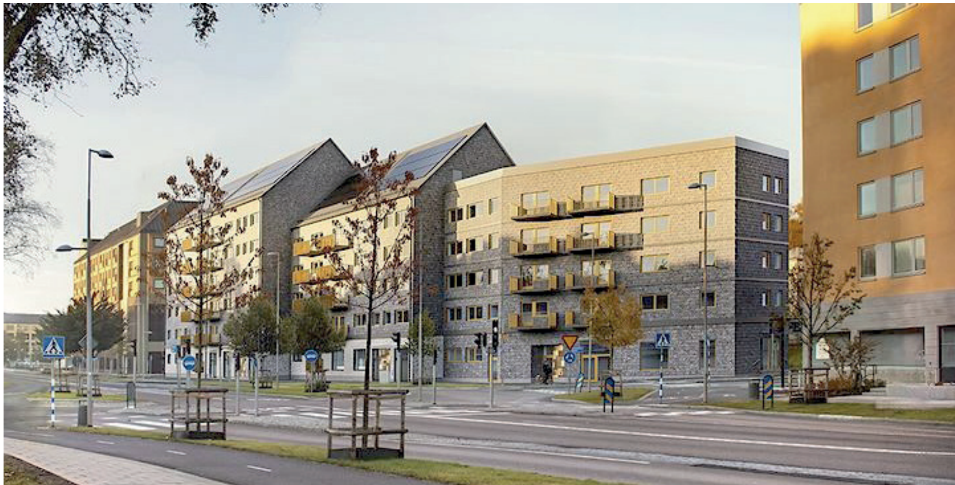
Återbrukat skiffer bidrar till halverad klimatpåverkan i kvarter Omställningen. Illustration: Liljewall